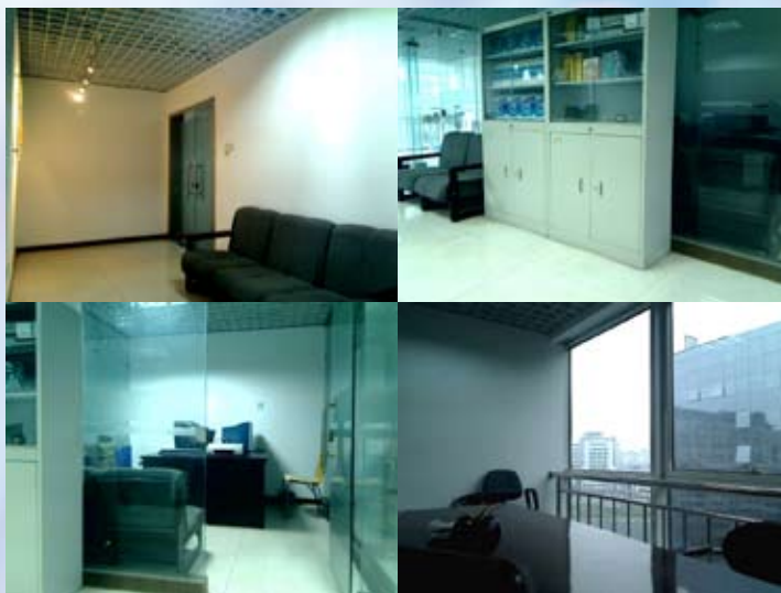
清扬视频会议现场图

咨询请联系：北京清扬创新公司 www.qycx.com 86-10-62978471